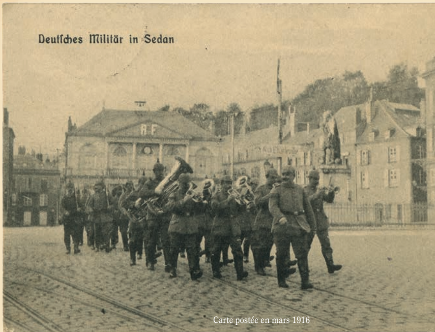
Carte postée en mars 1916