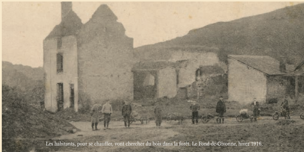
Les habitants, pour se chauffer, vont chercher du bois dans la forêt. Le Fond-de-Givonne, hiver 1916.