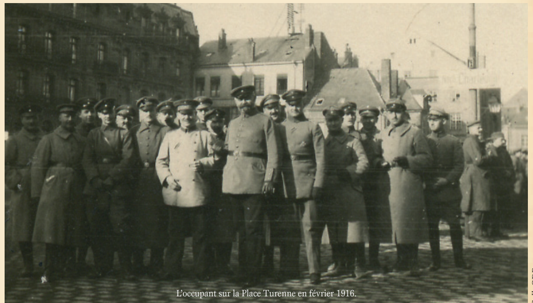
L'occupant sur la Place Turenne en février 1916.