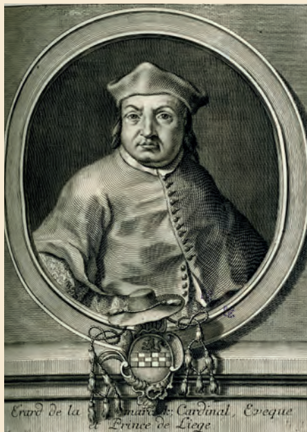
Énard de la Marck, Cardinal, Evêque de Liège.