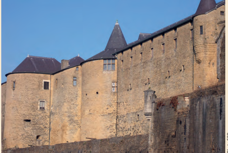
Énard est né au château de Sedan en 1472

En 1508, Énard décide de faire rebâtir le palais épiscopal de Liège. Toutefois, la principauté exsangue doit rassembler les fonds nécessaires, les