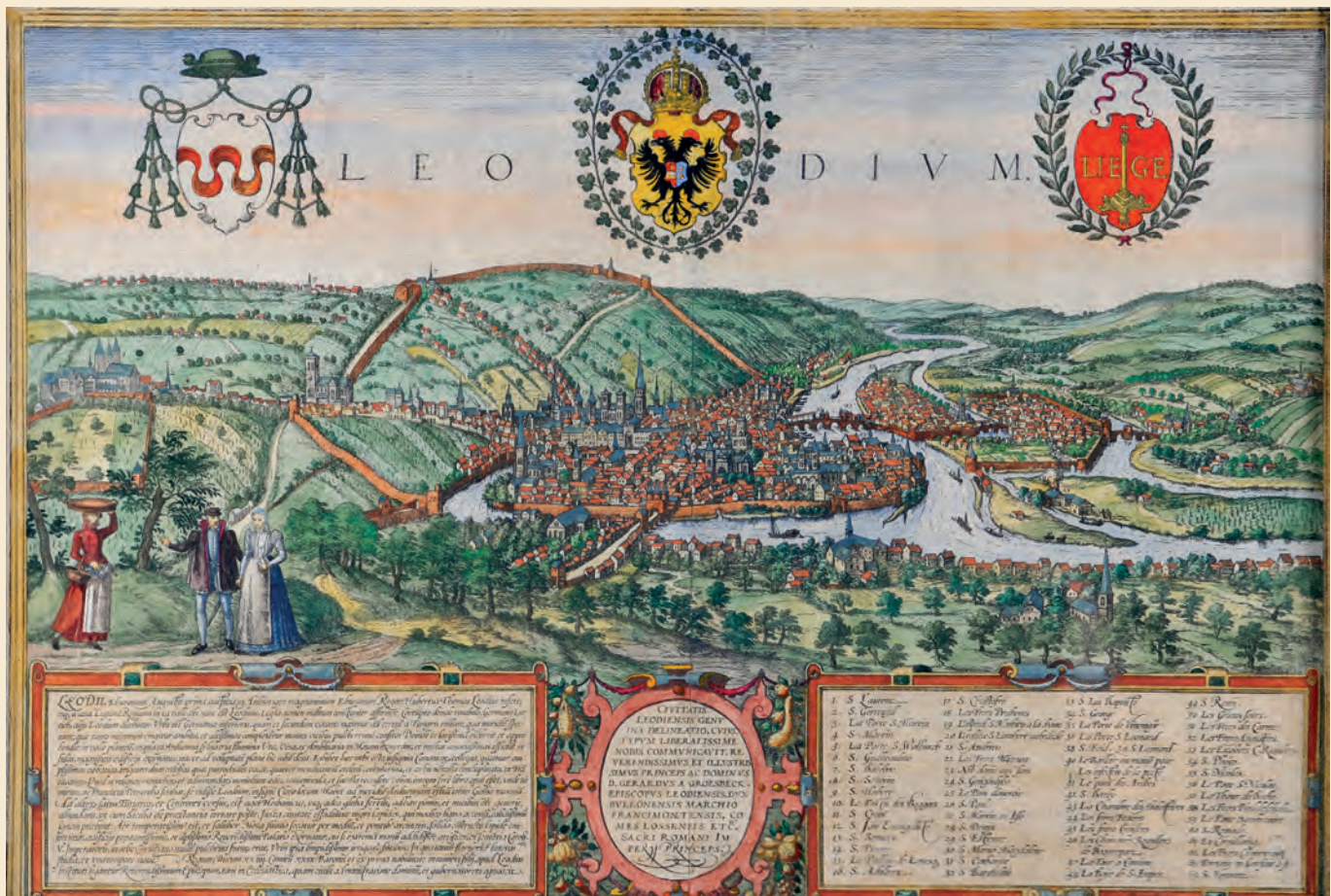
Leodium / Georges Braun ; gravé par Frans Hogenberg. Cologne : G. Braun, [1574].