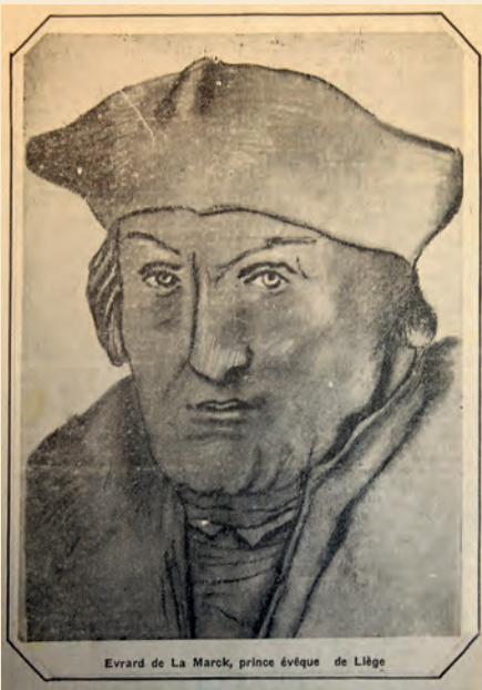
Le Journal des Ardennes, 15-26 août 1937