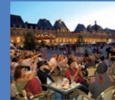
Place Ducale - Charleville-Mézières