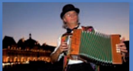
Charleville-Mézières - Festival des Marionnettes

Pont à Bar, Stenay, Dun sur Meuse, puis retour vers Pont à Bar