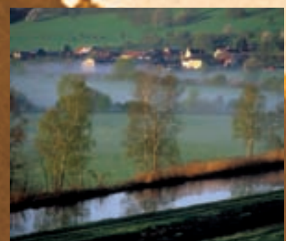
Onicourt - Canal des Ardennes