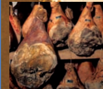
Jambon sec des Ardennes