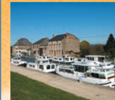
Base Ardennes Nautisme à Pont-à-Bar