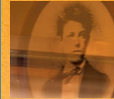
Musée Arthur Rimbaud

Tout au long de votre croisière, vous rencontrerez de nombreux témoins du passé historique et légendaire des Ardennes. Vos escales seront touristiques, gastronomiques ou sportives, vous savourerez les spécialités locales : jambon d'Ardenne, boudin blanc de Rethel, gibier, galette au sucre et bien sûr le Champagne.